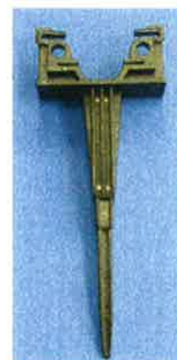
ミストエースR兼用保持具