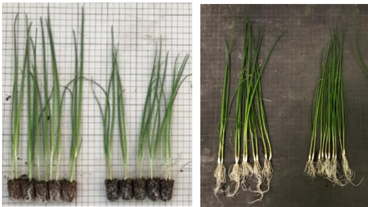
写真：播種後64日目の苗

< クイックN-800 > < 他社品 > < クイックN-800 > < 他社品 >