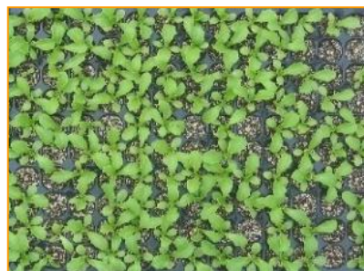
覆土無し苗 (レタス)