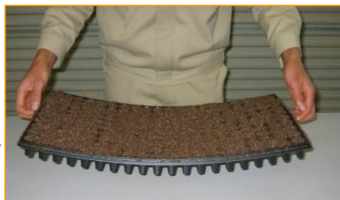
端までしっかりと詰めると苗揃いが良くなります