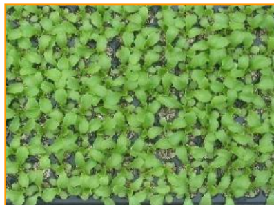
覆土有り苗 (レタス)