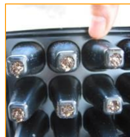
トレイ下の穴から水がしみ出してくる位が、初期灌水の適量です