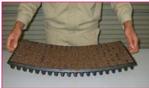
端までしっかりと詰めると苗揃いが良くなります