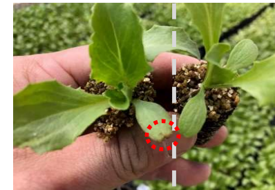
当社従来品 スミソイル®ロング

低温時に発生しやすい葉先焼け症状を軽減するなど、広い環境下で安心して使用できるように基材を配合し、肥料を混和しています。