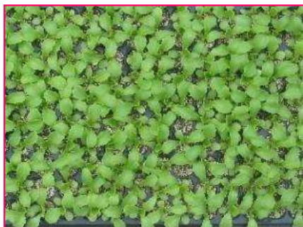
覆土有り苗 (レタス)