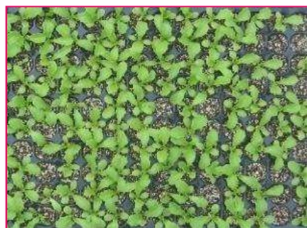
覆土無し苗 (レタス)