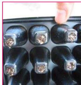
トレイ下の穴から水がしみ出してくる位が、初期灌水の適量です