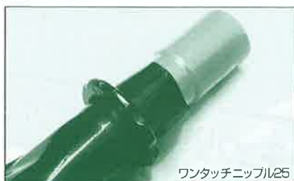
ワンタッチニップル25