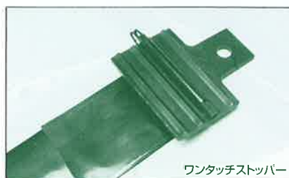
ワンタッチストッパー